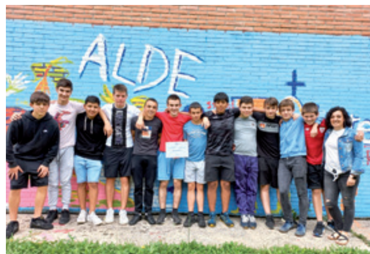
Arratia Institutuko ikasleak.

2008an abiarazo zan programa hau, eta ikasurtean zehar, gaitasun personalak garatutako tailerak, berbaldiak eta enpresetara bisitak programetan ditu. Parte hartzean daben ikasleek enpresa praktika bat garatu behar dabe ikasurtean zehar. DBHko lehen