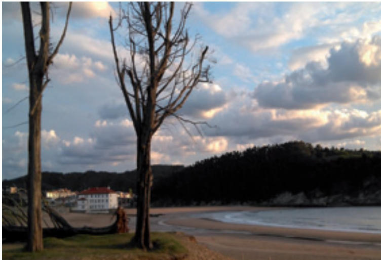
Plentziako Itsas Estazinoa.

Beste akats bat nahikotxo egiten dana da ura bakarrik aztertutea. Eta gu konturatu ginan, ba kutsatzaileak uretan badagoz, zergaitik ez dira egongo bertan bizi diran arrainetan? Baina ez da bardin, ura aztertutea edo arrain bat aztertutea. Eta ez da bardina arrainaren odola, giharra edo gibela aztertutea. Orduan metodo espezifikoak garatu behar izan genduzan kutsatzaile konkretu batzuk aztertuteko.