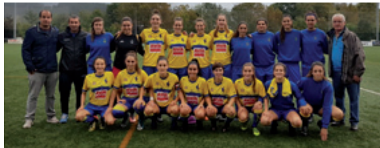
Arratia Futbol Taldea.

Arratia Bk, Emakumezkoen Lurraldekoan, Lurralde Mailan, jokatuten jarraituko dau datorren denporaldian be; ligea bosgarren eginda amaitu dau. Postu berean amaitu dabe Arratia Bko gizonak.