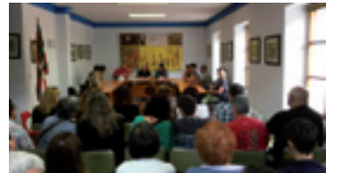
Dimako plenoa.

Beste herrietan gehiengo osoa eukan alderdiren batek. Alderdi horreetako zerrendaburuak izentau ebezan alkate.