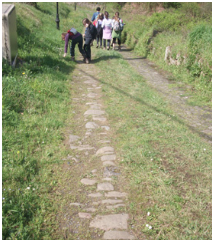
Kaltzadako harriak Ermitabarritik Entelladorenarako bidean.