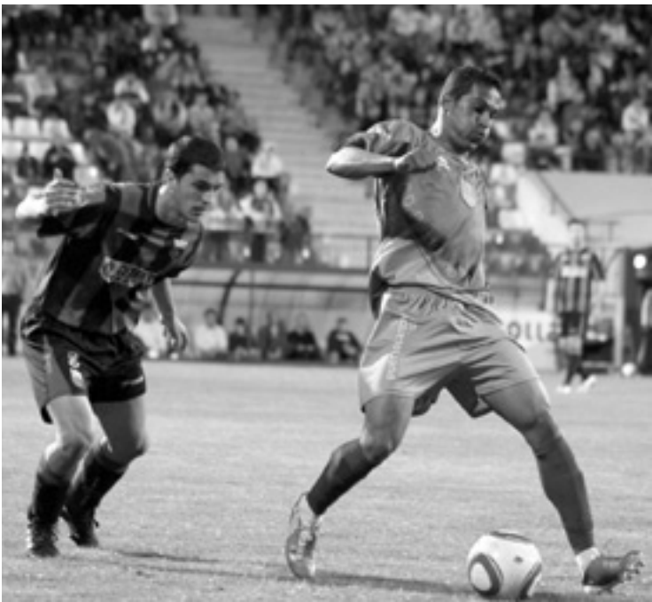
Puertollanoren kontrako joaneko partidua.