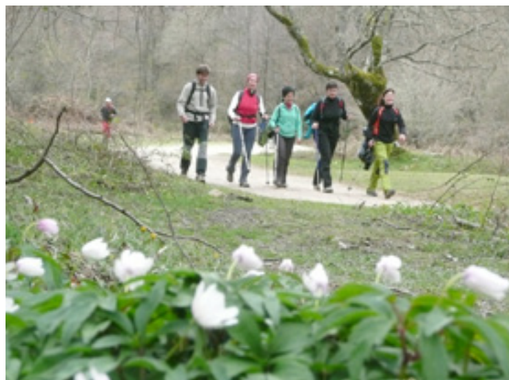
Igazko birako irudia.

Ubideko Birak paraje ederrak zeharkatzen ditu eta argazkiak atera ezker argazki lehiaketan parte hartu daiteke. Saria, Ubideko Urbide jatetxean persona birentzako afari edo bazkaria da. Argazkiak ubidekobira@gmail.com edo Ubideko Bira, San Juan 4, 48145 Ubide (Bizkaia)ra bialdu behar dira. Epaia urri lehenengoan emongo da.