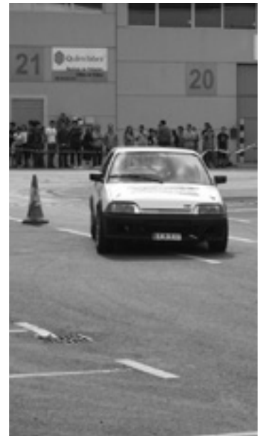
Dimako industrialdean autoa.