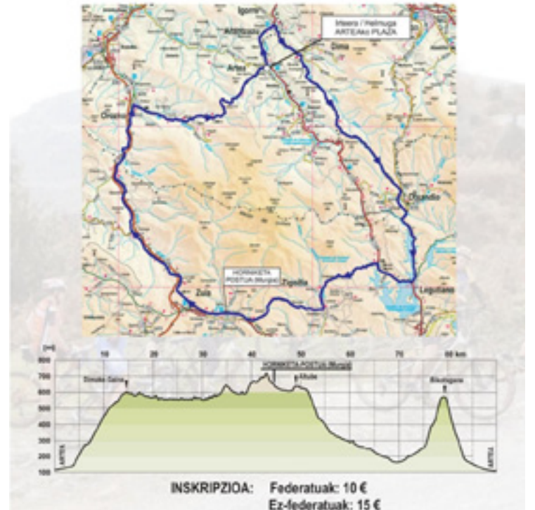
Martxearen ibilbidea eta grafikoa.