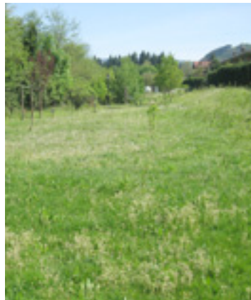
Haurreskolea hemen egongo da.

Haurreskolearen irekiera data oraindino ez dabela zehaztu dinoe Haurreskolak Partzuergoaren planifikazio zerbitzutik.