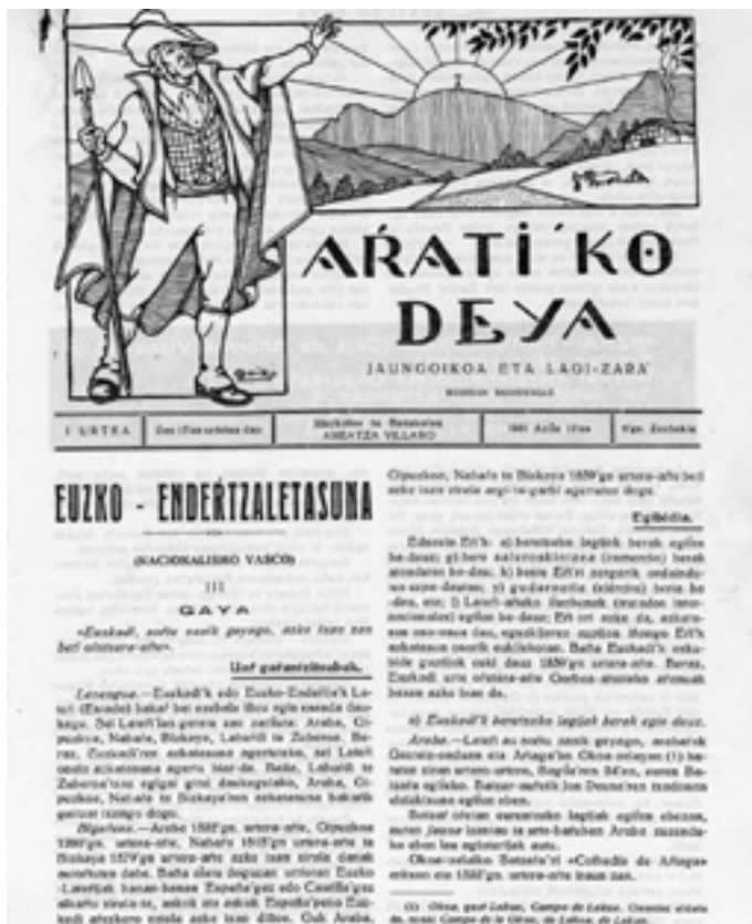
Arrati'ko Deya. 4. alearen lehenengo orrialdea.

Kutsu abertzale hori, idatzitako artikuluetan ezezik, aldizkariaren azalean jartzen eban "Jaungoikoa eta Lagi-Zarra" azpitu-luan susmatu daiteke, esaera hori EAJ/PNVren lema zan eta. Ganera, apirilaren 26ko Euzkadi egunkarian zera esaten zan: "Si alguien está obligado a comprar y a leer Arrati'ko Deya es el que se dice patriota vasco, y, por tanto, es de creer que todos los nacionalistas arratianos, han de ayudar con todas sus fuerzas al rotundo éxito de esta grandiosa empresa que los sitúa a la cabeza del movimiento vasquista rural. ¡Aurrera, arratianos!".