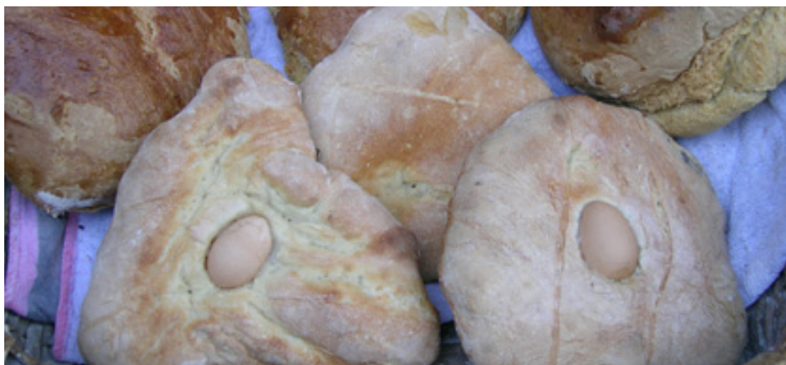
Mokotsa arrautza bategaz.

tzeko tradizioaren indarra galtzea beste sasoi batzuetan baserrietan astero egiten zan labe-suaren gainbehereagaz batera gertatu da. Lehenago baserri bakotxak, zapatuero aste osorako ogia egiten eban eta Pazko-domeka bezperan, Zapatu Santu egunean, asteko labe-sua aprobetxatuz egiten ziran mokotsak. Gaur egun, baserrietako labe-sua ia-ia iraganeko erlikia bihurtu bada be, badagoz haren hementika ohitura zaharari eusten deusien okindegiak, eta Arratia aldean... morrokotea oparitzeko aukerea izaten da, bertako okindegiak salgai izaten dabez eta.