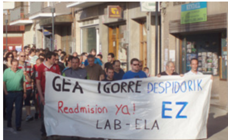
Berrehun lagunetik gora batu ziran Igorren egin zan manifestazioan.