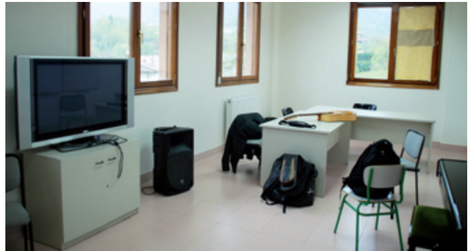
Arratiako Musika Eskolea.