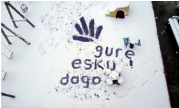
Maiatzaren 6an eukiko dabe igorretarrak botoa emoteko aukerea.

hasiko dira 12:00etan eta ordu erdi beranduago hasiko da zinegotzien babes ekitaldia. Ekitaldiari hasikerea emondakoan, maiatzaren 6ko herri konsulteari babesa emoten deusian adierazpena irakurri eta sinatu egingo dabe Igorren alkate eta zinegotzi izandakoak. Gero, aureskua edo agurra eta bertsoak eta kantuek