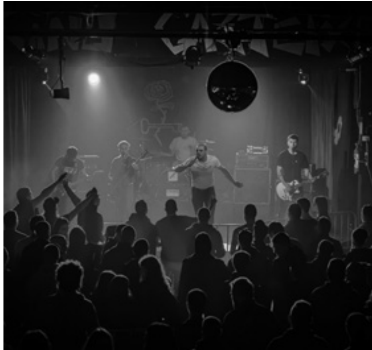
Gauetz kontzertuak egongo dira gaztetxean.