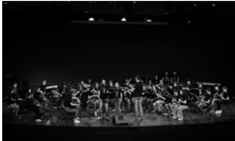
Arratiako Musika Eskolako ikasleak igaz Tarragonan.

Aprilaren 17an Arratia eta inguruak bisitetan egongo dira eskola bietako kideak eta datorren egunean, zapatua, kontzertu bateratua eskainiko dabe Igoerreko Lasarte Aretoan, 18:30ean. Domekan oster, 12:00etan, Ailarak-Musiktopa zentroan -lehenagoko Ekomuseoa- lehenengo emonaldi irekia egingo da. Eguzkilore kontzertuaren bigarren edizioa izango da eta euskal musika tresna tradizionalak entzuteko aukerea egongo da: albokea, txistua, trikitixea,