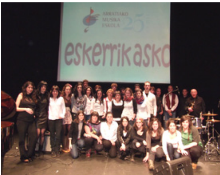
Arratiako Musika Eskolako ikasleen kontzertuko irudia.

Oroigarriak bananduko dira gero, 25 urte honeetan eskolari babesa emon deutesien hainbateri, eta, ezin zan bestela izan, musikeagaz amaituko da ekitaldia.