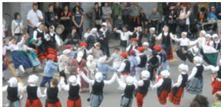
Igazko Dantzari Txiki eguna.