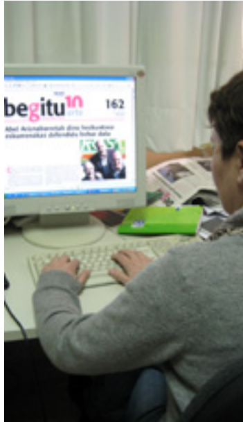
BEGITUREN erredakzioa Artean.