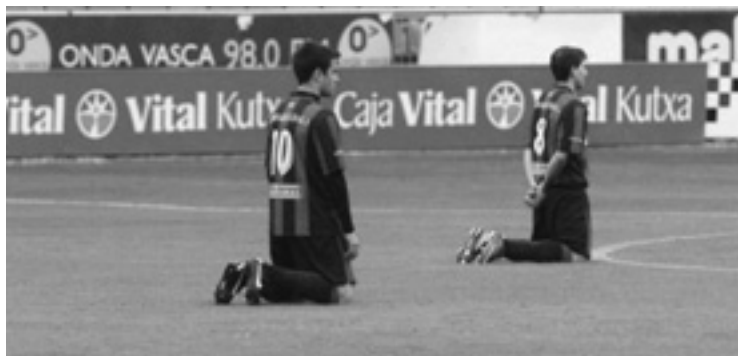
Lemoako jokalariek belauniko Mendizorrotzan.

go jarraituten dabe. Ez dabe jokatu partidurik hamabostaldi honetan eta hurrengo Peña Athleticen kontra jokatu dabe Urbietan hilaren 21ean, zapatua, 19:45ean.