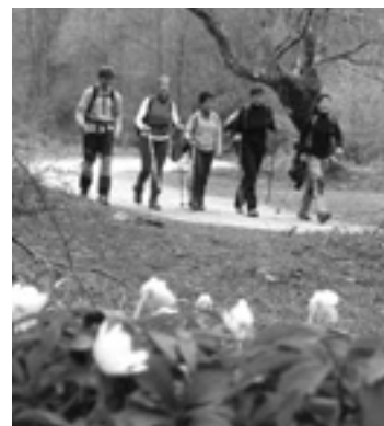
Ibiltariak Ubideko Biran.

Ubideko Biran parte hartu eta ibilbide bat osotuten dabenak edalontzi bat izango dabe opari moduan, hamaiketako doban eta Ubideko produktuen otzara baten zozketan be hartuko dabe parte.