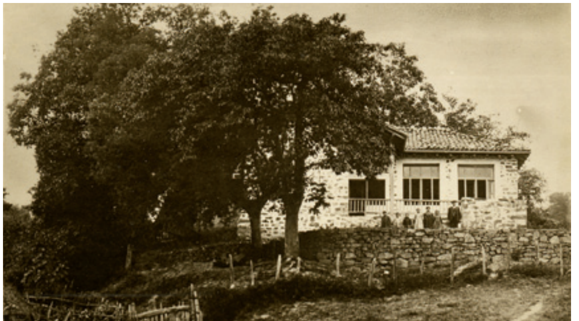
Uribeko auzo eskolea (Zeanuri).