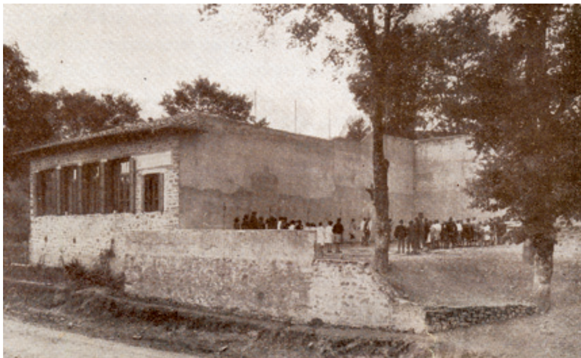
Ermitabarriko auzo eskolea (Zeberio).

Auzo eskola hareek eskola funtzioa galdu badabe be, gehienak gaur egun beste funtzio sozial garrantzitsu bat jokatzeko eraldatuak izan dira: auzokideen bilgune izateko.