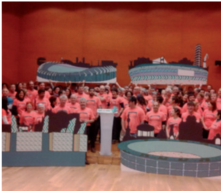
Gure Esku Dagoren bagilaren 21eko ekimenaren aurkezpena.

Lemoako Plaza Gorrian Lemoa eta Bediako jentea batuko da 12:00etan, herri bi horreetako hamabost oihalak alkarregaz josteko.