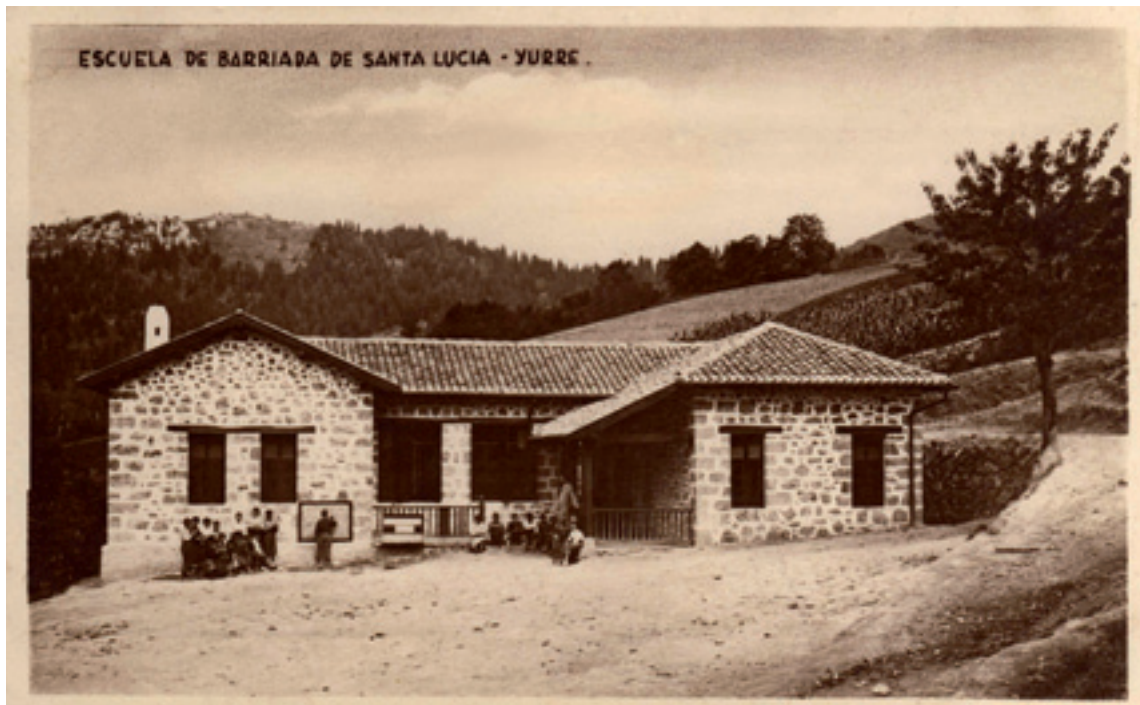
Santa Luziako (San Kristobal, Igorre) auzo eskolea.

Arratia aldean guztira hamaika auzo eskola altxau ziran; Diman hiru, Zeanurín lau, Igorren bat, Lemoan bi eta Bedian bat. Zeberion bi eskola zabaldu ziran