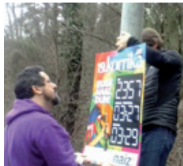
AEKkoak bidea marketan.

Irakurleak holan eskatuta, Korrikako argazki gehiago doaz oraingo zenbakian: batzuk, gehienak, irakurleak eurak ateratakoak eta BEGItura bialdutakoak; beste batzuk, aurrekoan atera barik geratu jakuzanak.