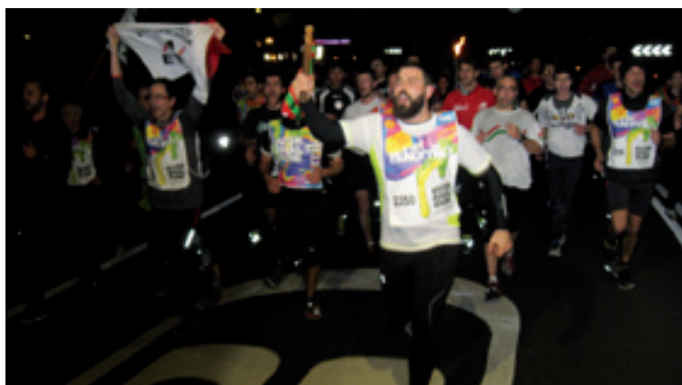
Araluceko langileen kilometroa.