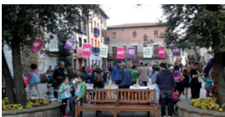
Korrika pasau zaneke arrastia Areatzan.