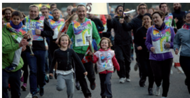
Ibon Izak bialdutako argazkia.