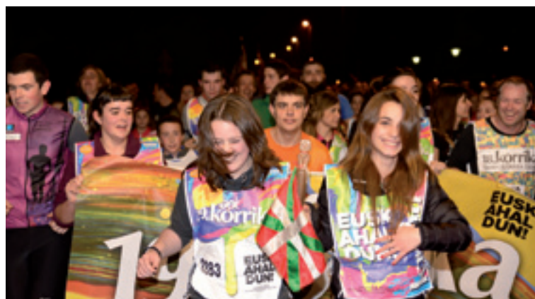
Arratia Institutuaren kilometroa.

Diman herrigunetik kanpo internet zerbitzua Euskaltelek emoten dau, Wimax teknologia erabiliz. Udal iturrien arabera, martxan ipini zanetik zerbitzuak ez dau eboluzinorik izan, eta momentu honetan oso abiadura txikia eskeintzen dau, leku batzuetara ez da ailegetan eta garestia da. Enpresa barri batek abiadura handiagoa eta prezio merkeagoan froga bat egitea eskeini dau. Sistema martxan ipinteko enpresek ekipamentuan inbersinoa egin behar dau eta bideragarria izan daiten, 40 persona behar dira zerbitzu barria kontratatuko. Hori dala eta, interneteko sarbide-hornitzailea aldatuteko interesa daukienai dei egiten deutse udalak euren datuak emon dagien udaletxean.