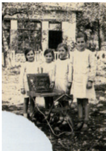
Artaungo eskolako neska ikasleak (Dima).

Arratian hamaika eta Zeberion auzo eskola bi zabaldu ziran 1921etik 1933ra.