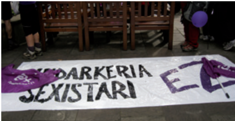
Indarkeria sexistearen kasuen % 10 baino ez dira azaleratzen.