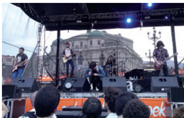
Eskean Kristö Bilbon.