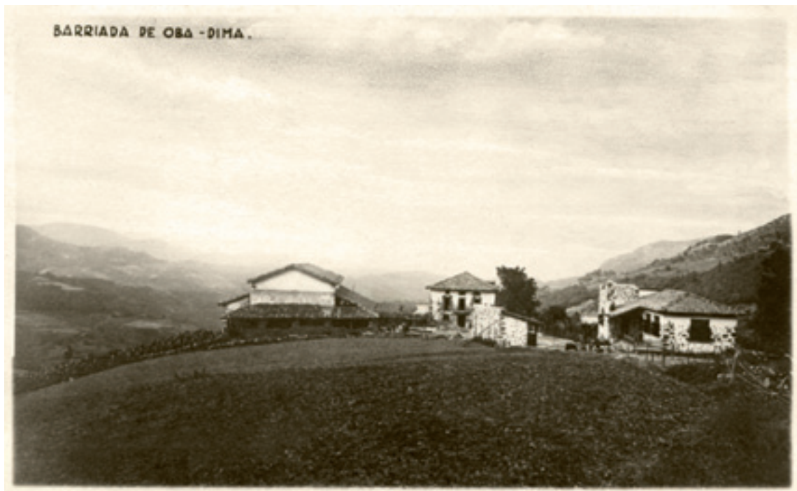
Obako auzo eskolea (Dima).

(...) Baye etzagunik geyenen umeak, gurasoak eskolea egi-