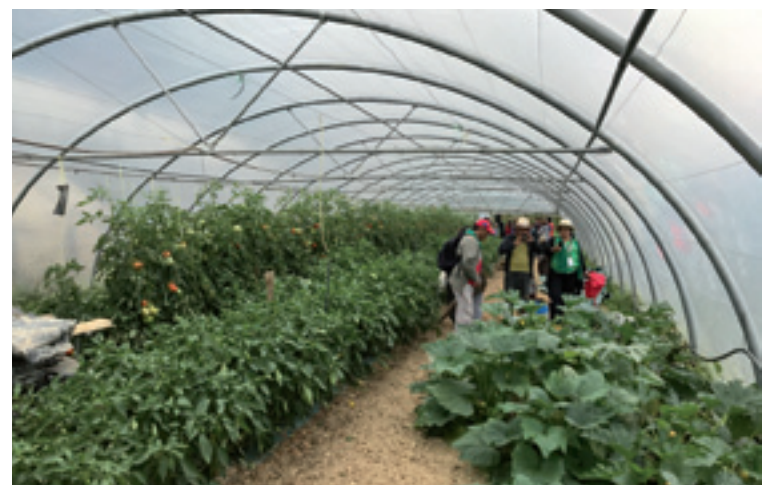
Kiñu Gaztetxea, Herriko Benta eta Etxebarrieiko ustiapena.