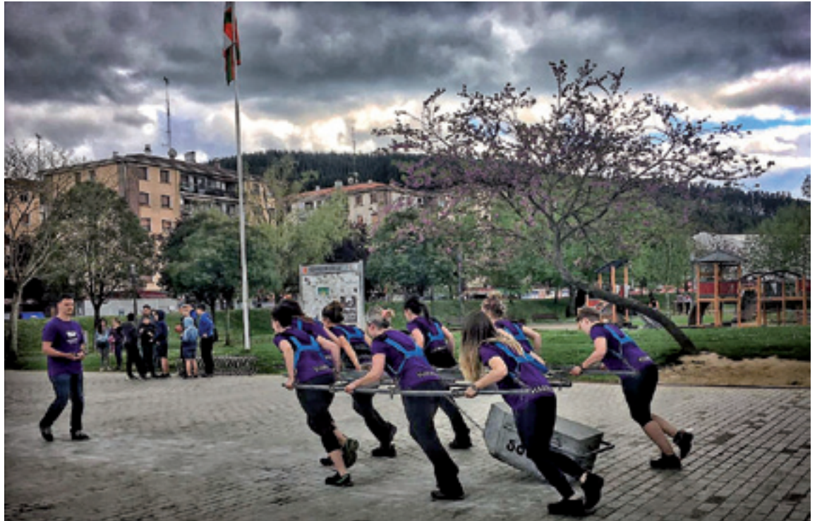
Harriti taldekoak Igorren erakustaldi baten.

Bermeoko auzo bateko jaiak dira, Almike auzokoak. Igaz be egon ginan eta Emarrigaz neurtu ginan. Aurten hiru talde egongo gara. Gu