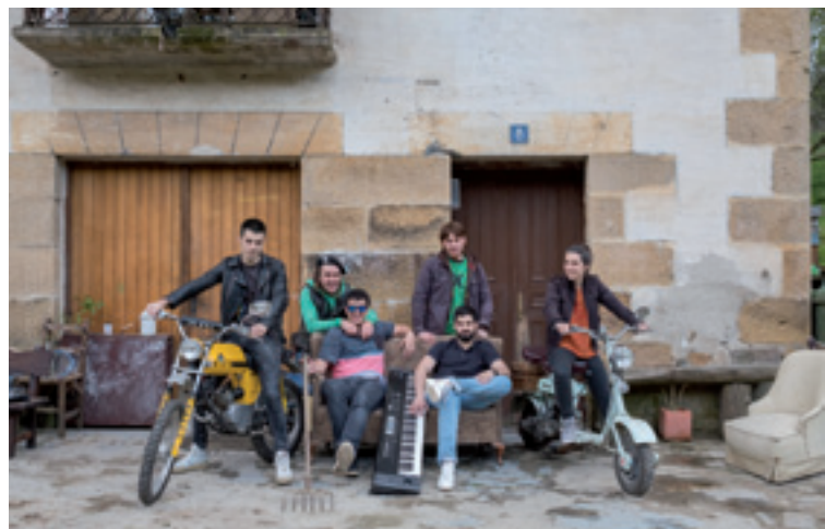
Zazkel taldeko kideak.