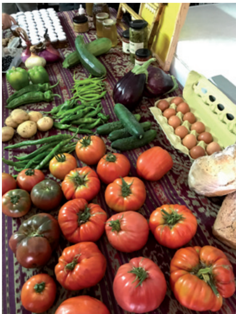
Etxebarrie baserriko produktuak.

"Udalaren partaidetza funtsezkoa izan zan" azaldu eutsen Ayusok Via Campesinakoai; izan be, proiektua Zeberioiko Udalak bultzatutako Nekazalgunea programearen barruan egoan. Programa honegaz, besteak beste, Udalak lurrak eta konserbarea egiteko eraikina baldintza ekonomiko egokietan ipini ebezan baserriar gazte talde baten eskura. Lur Funtsa be sortu eban, eta lur jabe eta