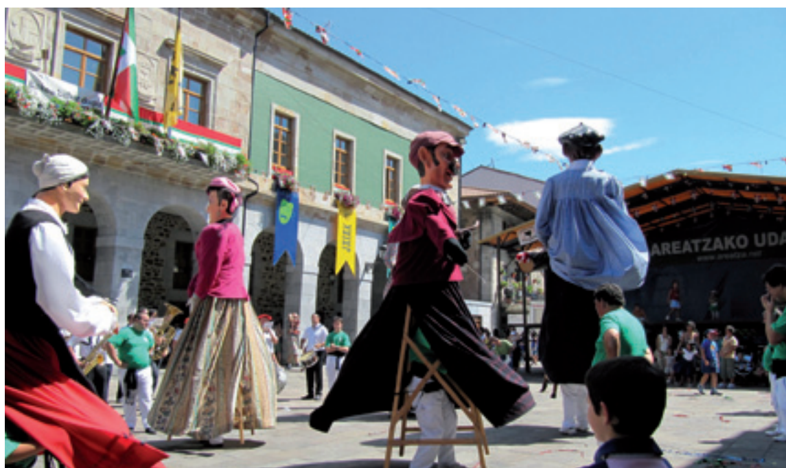
Areatzako txupina erraldoiakaz.