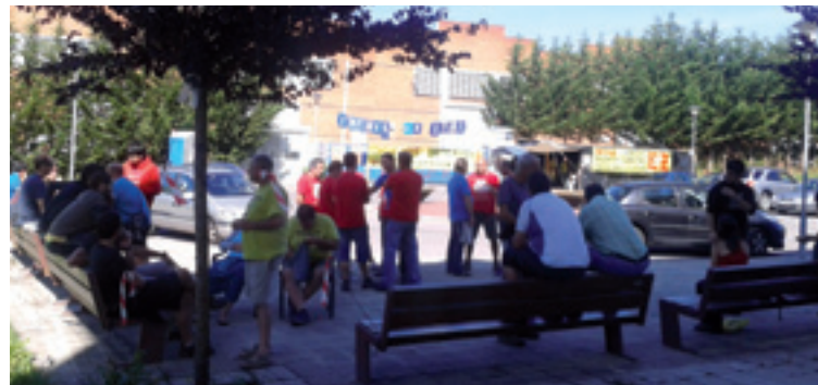
Incoesako beharginak eta arratiarrak enpresa kanpokaldean.