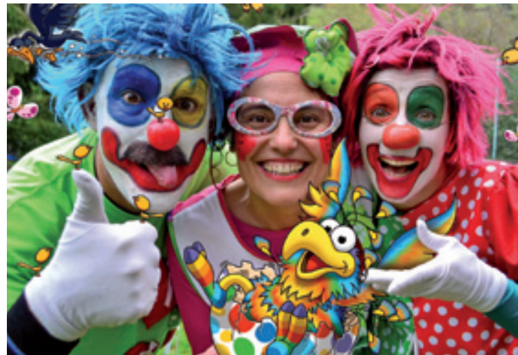
Pirritx, Porrotx eta Marimotots.

18:30 etan, Pirritx, Porrotx eta Marimotots pailazoaren Sentitu, pentsatu, ekin ikuskizuna.