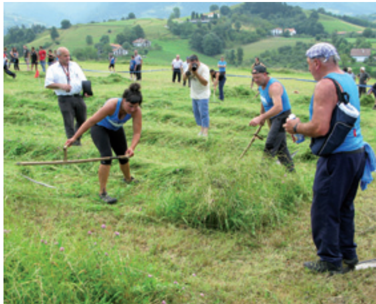
Zizurkilen jokatu zan I. Emakumezkoen Euskal Herriko Segagaitik Txapelketa.