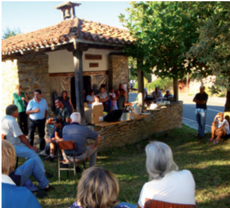
Igaz urri lehenengoan auzokoak egin eben bazkaria.