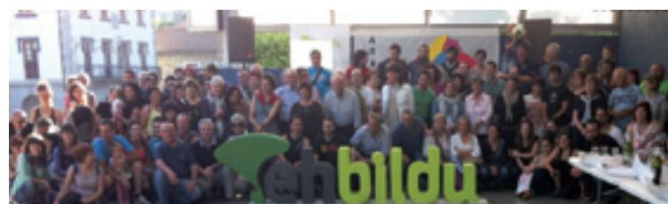
Ekitaldi amaieran ateratako argazkia.

deak hartu eban berbea arratiarrai datozen urte bietan be modu