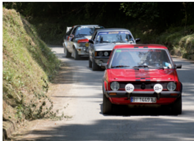
Hiru auto ibilbidea egiten.

Vizcaya). "Sano maila oneko rallya izan zan eta partaidetza handia izan eban. Bizkaia, Araba, Gipuzkoa, Kantabria, Madril eta Aragoi aldetik etorrita". Proba hau garagarrilaren 13an jokatu zan, CERCA txapelketearen barruan.