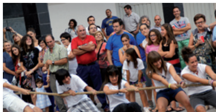
Zeanuriko gazteak sokatiran.