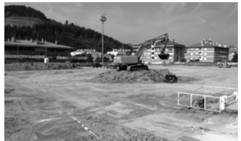
Futbol zelaiko lanak aurrera doaz.

Lan honeek lurzorua bedar artifiziala jartzeko prest itxiko dabe. "Lan guztiak urri lehenengoan bukatuta egotea espero da, hola herriko futbol taldeak futbol zelaia denporaldi hasikerarako prest izango dabe" azaldu deustie BEGITURI Udaleko komunikazio sailetik. Futbol zelai honetan, Lemoa Berri eta Harrobi taldeak jokatu dabe.