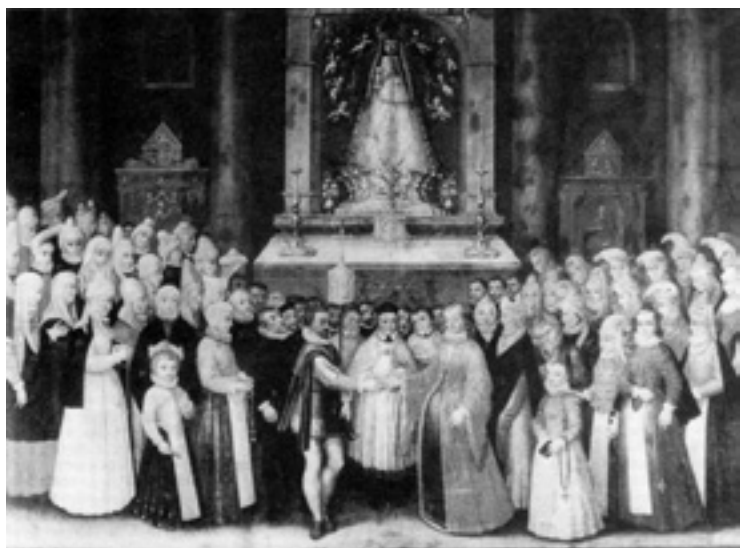
"Boda de hidalgos" koadroa.

"Buruan jartzen zan txano hau fieltrozkoa izaten zan. Jaiegunetan ipinten zan, baina XX. mendean lehenengo hamarkadetan eroate-