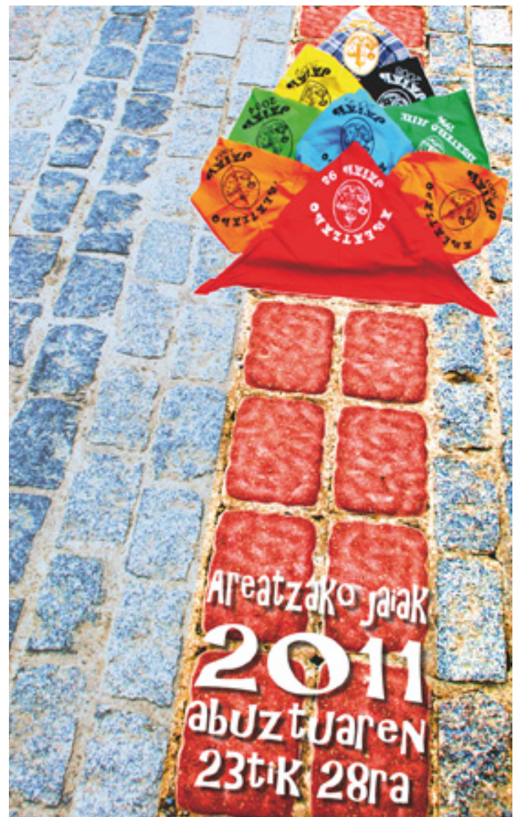
Areatzako jaietako kartela.