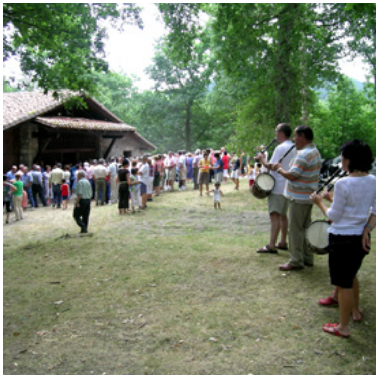
San Justoko erromeria.

* 17:30ean: Bola txapelketea eta Mus txapelketea.