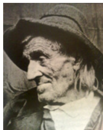
Arratiako gizona kapelagaz.