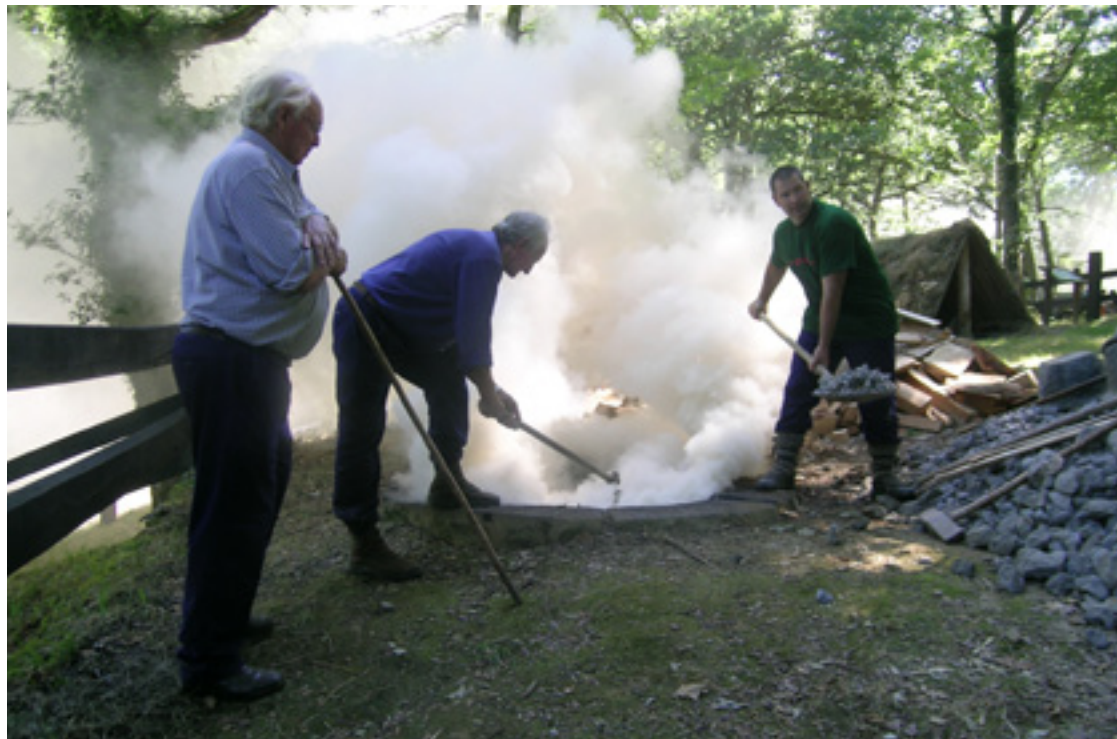
San Justoko karobia.