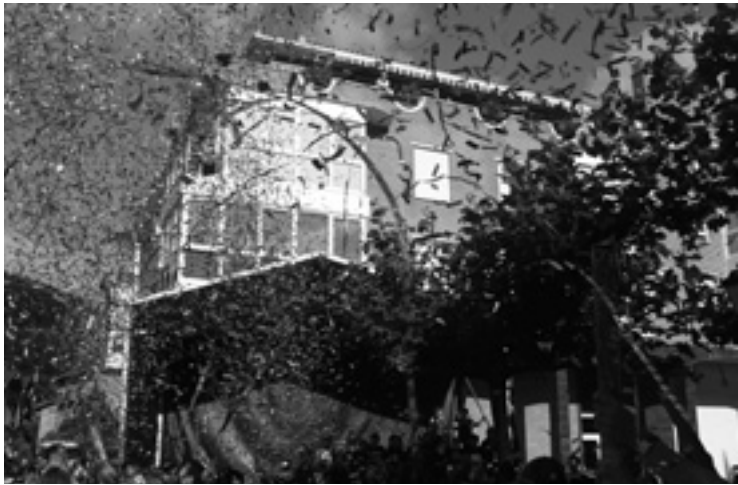
Igazko Zeanuriko txupina.

Jaietako bost egunetan, herriko txistulari eta trikitilariak esnatuko dabez zeanuriztarrak euren soinu alaiakaz.