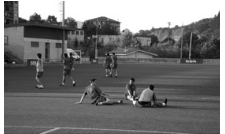
Lemoa futbol taldekoak Igorren entrenetan.

izango da, aurreko eguneko partiduak 18:00etan jokotuko dira Urbietan zelaian.