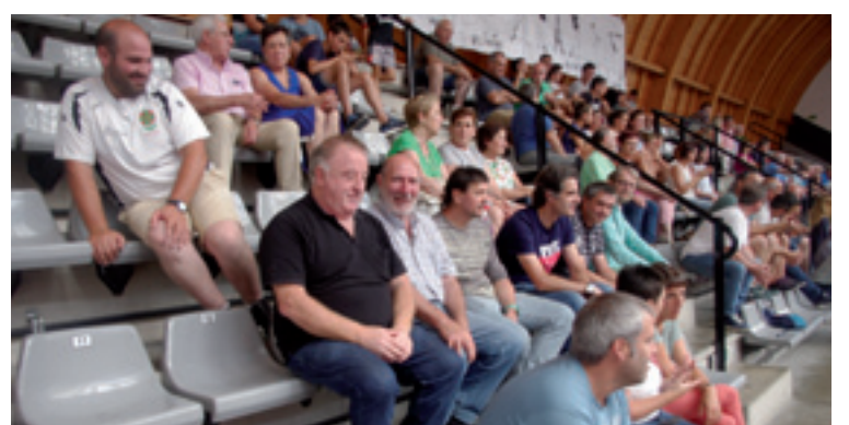
Jon Urutxurtuk Zumarragan eta Zeanurin ateratako argazkiak.