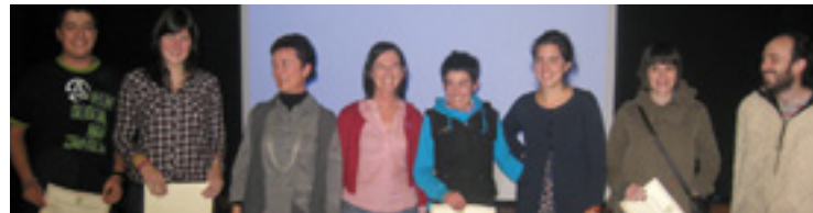
Beldur Barik lehiaketako sari banaketea.