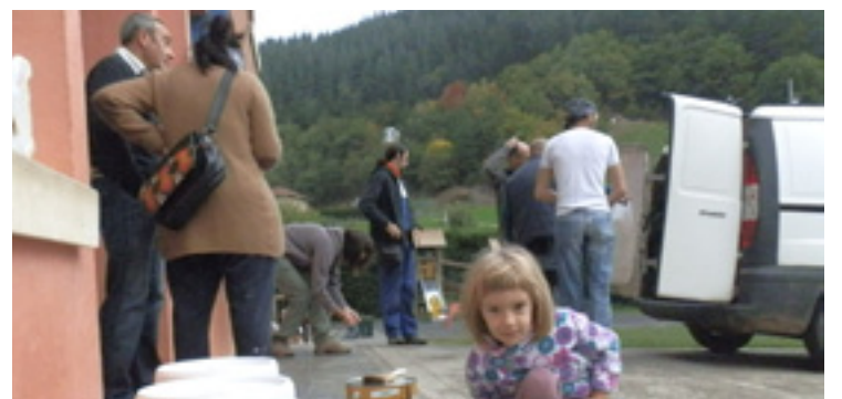
Dimako eskolan auzolanean herritarrek.

Lehenengo hiru hilekoan, lan taldeak, margotze-lanak, konponketak, segurtasuna bermatzeko lanak eta zabu eta txinboen azterketea egingo dabez, beste batzuen artean. "Hau guztia bideratzeko, batzorde bako-tzak bere aurrelanak egin behar izan ditu: lan plangintzearen diseinua egin, aurrekontuak eskatu, garbiketa lanak, material eskariak...".