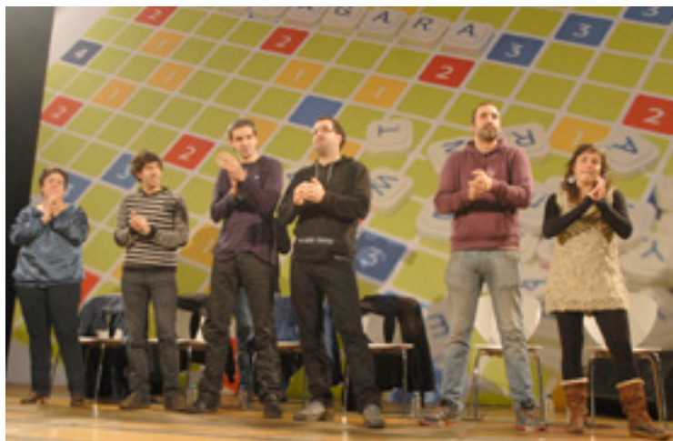
Basauriko saioko bertsolariak.