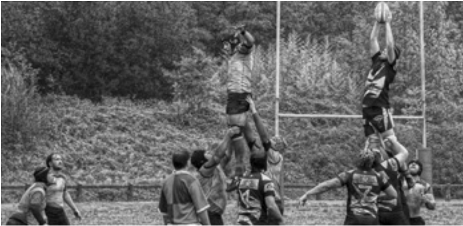
Arratiko Zekorren partidu bat San Txismen.