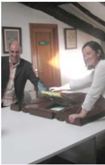
Uriguen eta Gorospe.

Arratiako Udalen Mankomunitateak sukaldatu bako landara eta barazki jatorria daukien hondakinak gaika biltzeako zerbitzua ipini dau martxan.