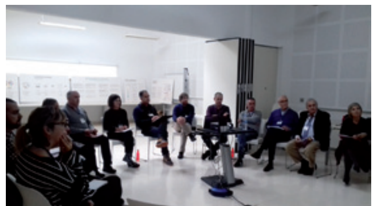
Arratiako Enpresa Foroaren lehenengo saioa.

Lehenengo saio honetan parte hartu eben baino enpresa gehiagok erakutsi dabe Foroaren gaineko interesa eta danai bialduko jakie zemendiko saioan landutakoaren txostena. Hurrengo saioa udabarrirako aurreikusten da. Errota Fundazioagaz hartu emonetan ipinteko, info@errota.eus-era idatzi edo 688 854 543 telefonora deitu daiteke.