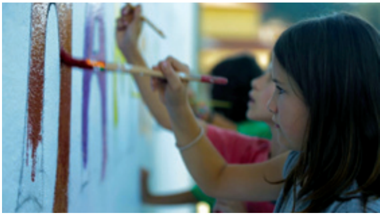
Markak filmaren irudi bat.

Abenduaren 3an Euskerearen Nazinoarteko Eguna da eta urtero lez, Arratiak jaigiroan ospatu eta aldarrikatuko dau euskerearen erabilera. Arratia mailan ikas komunitadeak sendo landu dau eguna. Arratiako marka izan gura dauan Markak izeneko bideoa aurkeztuko da egunotan. Jendartearen euskereagazko konpromisoa bultzatzeko ekitaldiak egingo dira herrietan eta aisialdiari lotutako jardura moltsoa antolatu ditue udalak eta alkarteak.