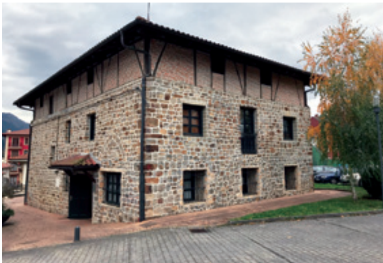
Arratiako Udalen Mankomunitatea.

Arratiako Udalen Mankomunitateko (AUM) Gizartekintza Sailak emondako datuen arabera, zemendiaren 15era arte, 13 andrazko atendidu ditu zerbitzuak genero indarkeria dala-eta. 2016an, 23 izan ziran.