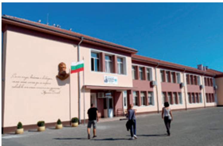
Zeberio umeak Pomorieko eskolara egindako bisitan.

Errepublikak, Finlandia, Letonia, eta abar. Proiektu honek, aurten be, bidaiatzeko eta beste kultura bat ezetuteko aukerea emongo deutse eskolako 6. mailako umei. Ez hori bakarrik, ingelesez ekiteko aukera aparta izango da-be-ta. Pomorie da zeberioztarrek bisitauko daben herria, eta Bulgariako kostaldean dago, Itsaso Baltzaren ertzean, hain zuzen be. Hegazkin bi eta autobusa hartu