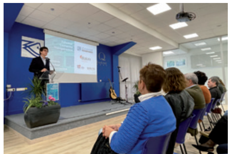
Inaugurazino ekitaldiko irudi bi.