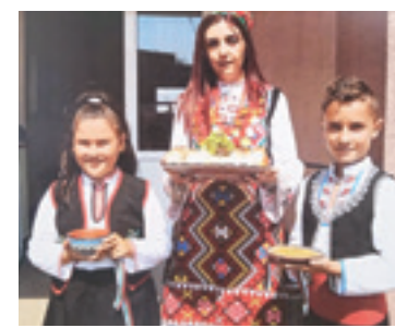
Pomorieko irakasle eta umeek tradiziozko erropak jantzita, ondoetorri jatekoakaz.

lagunak, eta maiatzean Pomoriera bidaiatzeko zeberioztar gazteen txandea izango da.