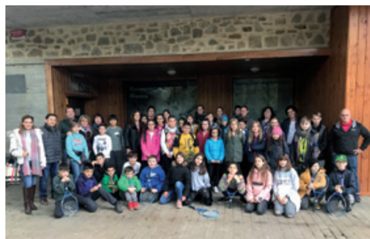
Ikasle eta irakasleak Zeberioko Errementari Museon.

baten behar egitea da helburua. Edizino honetan gaia energia dala eta, energia zelan sortuten zan eta sortuten dan ikasten dabiz gazteak. Bertako aitita-amamakaz egoteko asmoa be badaukie, lehenago zelan bizi ziran jakiteko. Txipre, Letonia eta Txekiako etorri diran bisita honetan hainbat izan dira lau herrialdeetako umeak bisitatu dabazan lekuak: Muskizeko El Pobal burdinolea, herriko jubilauekaz batera taloak